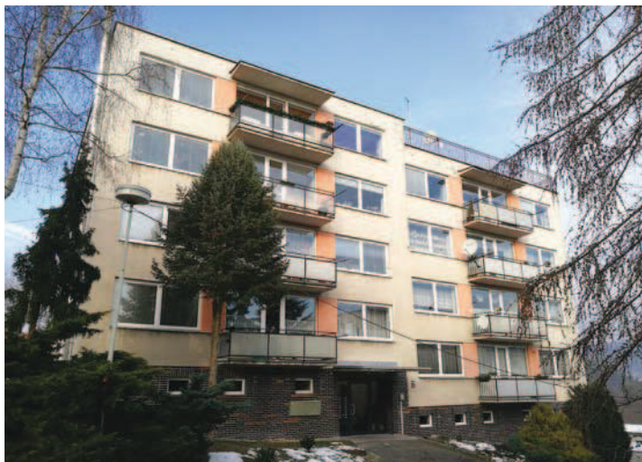
Celkový pohled na dům v Řecké ulici. Realizací nového výtahu se jeho účetní hodnota zvýšila o téměř dva milióny korun, vyššího zhodnocení se ale stavbou dočkaly všechny bytové jednotky.